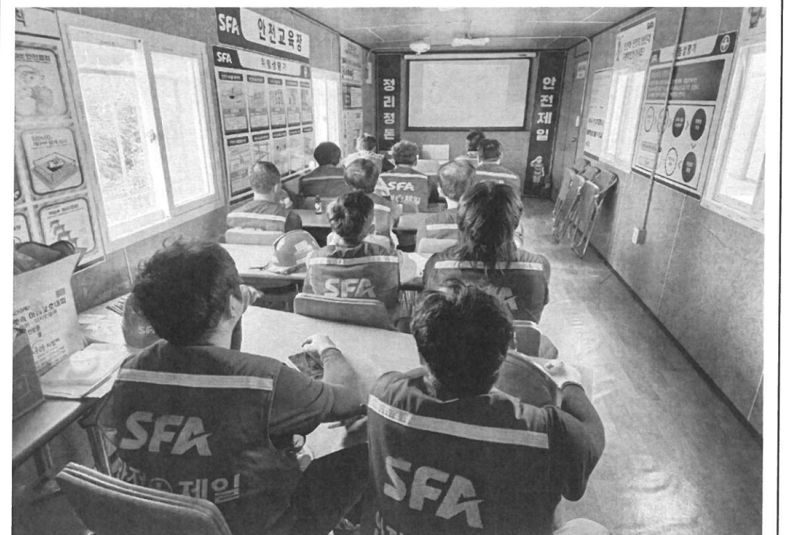
공사명 삼성전자로지텍 이천현장 일시 2023.07.25 내용 7월 정기안전보건교육