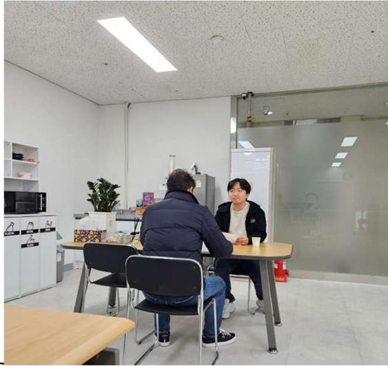
건설업 기초안전 보건교육 이수증 및 혈압측정