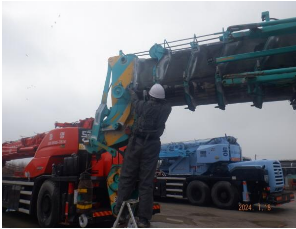
메인 붐 상부