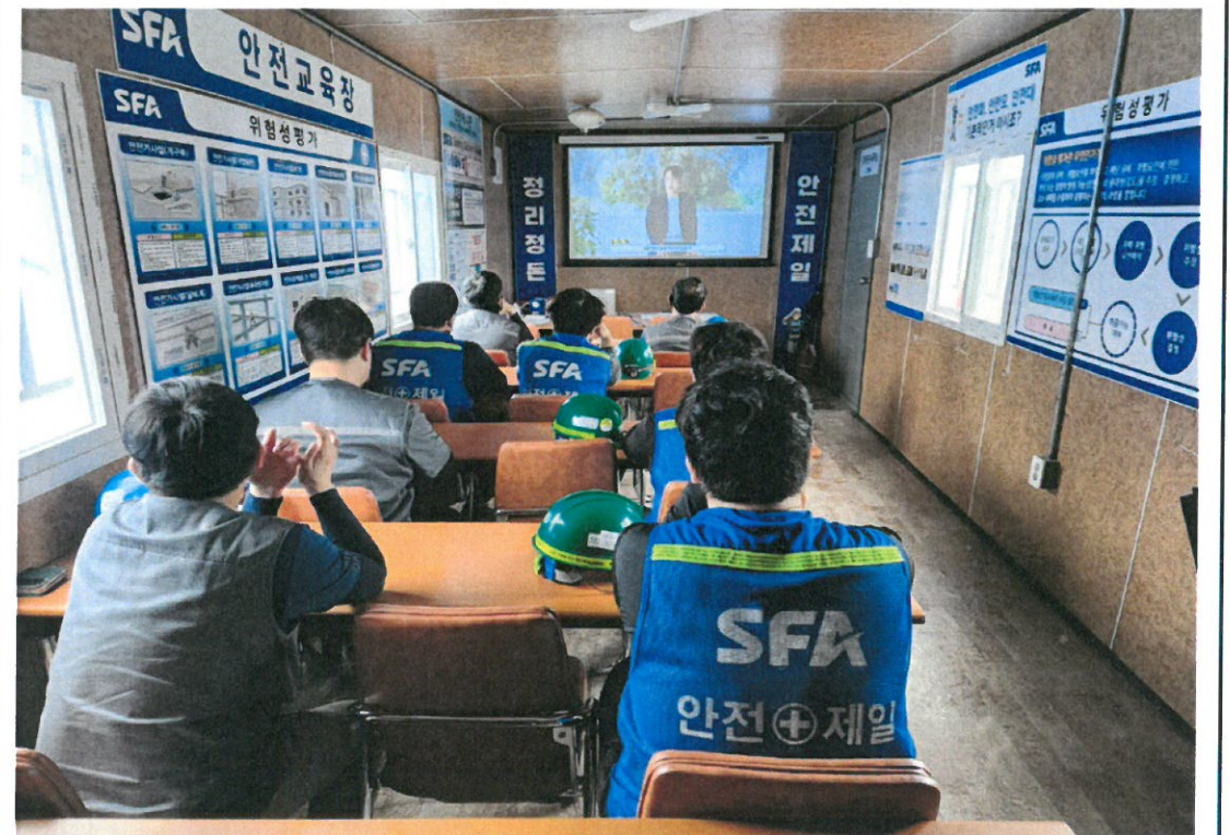
공사명 삼성전자로지텍 이천현장 일시 2023.09.20 내용 9월 정기안전보건교육