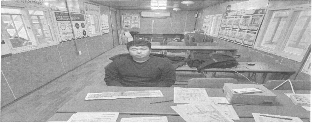
건설업 기초안전 보건교육 이수증