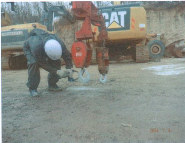
메인 훅 블럭