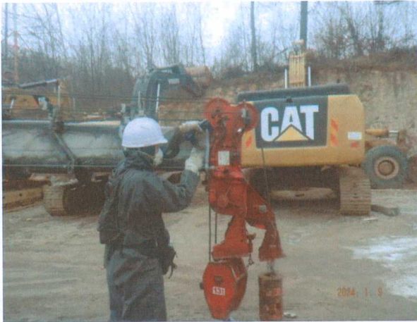
메인 붐 상부