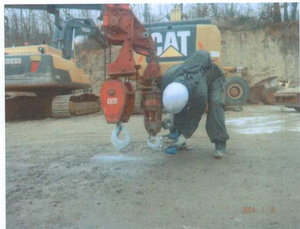
보조 훅 블럭